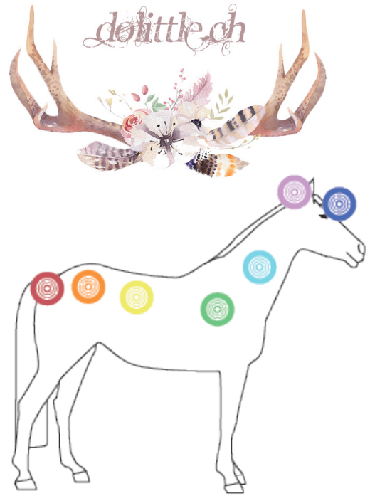
Chakra-System beim Pferd